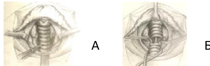
Рисунок 1 – .....

Если в тексте диссертации один рисунок, состоит из нескольких частей, то на этих частях должны быть указаны номера позиций этих составных частей в пределах данного рисунка , которые располагают в возрастающем порядке